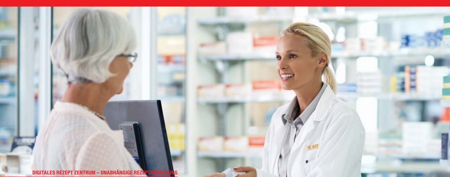
DIGITALES REZEPT ZENTRUM – UNABHÄNGIGE REZEPTABRECHNUNG