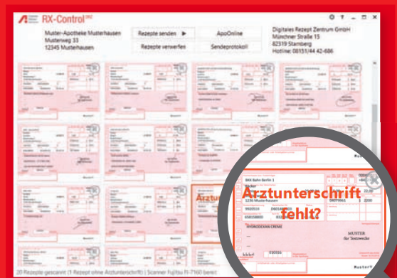
Beispiel für fehlende Arztunterschrift