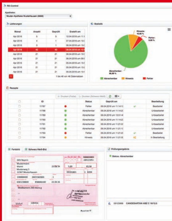
Übersichtliche Anzeige der Prüfergebnisse

Selbst nicht automatisch erkannte Rezepte werden vom Personal des DRZ erfasst. Eine nachträgliche Erfassung Ihrerseits ist nicht mehr nötig!